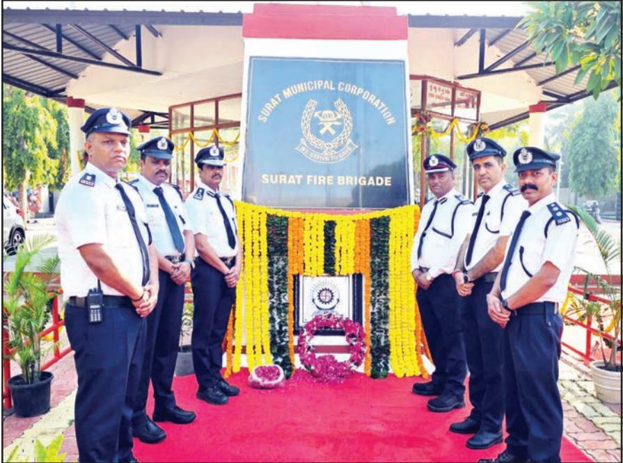
સુરત સહિત દેશભરમાં દર વર્ષે ૧૪ એપ્રિલના રોજ અગ્નિશામન દિવસ (ફાયર સર્વિસ ડે) તરીકે ઉજવાઈ કરવામાં આવે છે. વર્ષ ૧૯૪૪માં આ જ દિવસે મુંબઈ ગોદામાં લંગારાચેલા જહાજમાં ભયાનક આગ અને વિસ્ફોટ સર્જતા ૬૬ જેટલા ફાયર જવાનો શહીદ થયા હતા. તેમના અદમ્ય સાહસ અને બલિદાનની યાદમાં આ દિવસ ઉજવાવામાં આવે છે. ફાયર સર્વિસ ડે નિમિત્તે સુરત ફાયર બ્રિગેડ દ્વારા અઠવાલાઈન્સ ચોપાટી ખાતે આવેલા શહીદ સ્મારક ખાતે ફરજ દરમિયાન શહીદ થયેલા લાકરોને સલામી આપવામાં આવી હતી. (તસવીર : હનીફ મલેક)

યુદ્ધમાં ઈરાનનું ચાલુ પેશ્વર-૨ પાનાનું ચાલુ જેના સફળ પડ્યા પડતા યુધ્ધની ભીપણ પરિસ્થિતિ વચ્ચે વલસાડ નવસારી જિલ્લાના માછીમાર ભાઈઓ સહી સલામત રહે તેવા તમામ પ્રયત્નો કરવામાં આવ્યા હતા. આખરે તા. ૧૧ એપ્રિલના રોજ સવારે ૧૦ કલાકે ૭૨ માછીમાર ભાઈઓ ઈરાનની ઈન્ડિયા આવવા ફલાઈટમાં બેઠા હતા અને રાત્રિના ૮ કલાકે ચેન્નાઈથી બે બસમાં